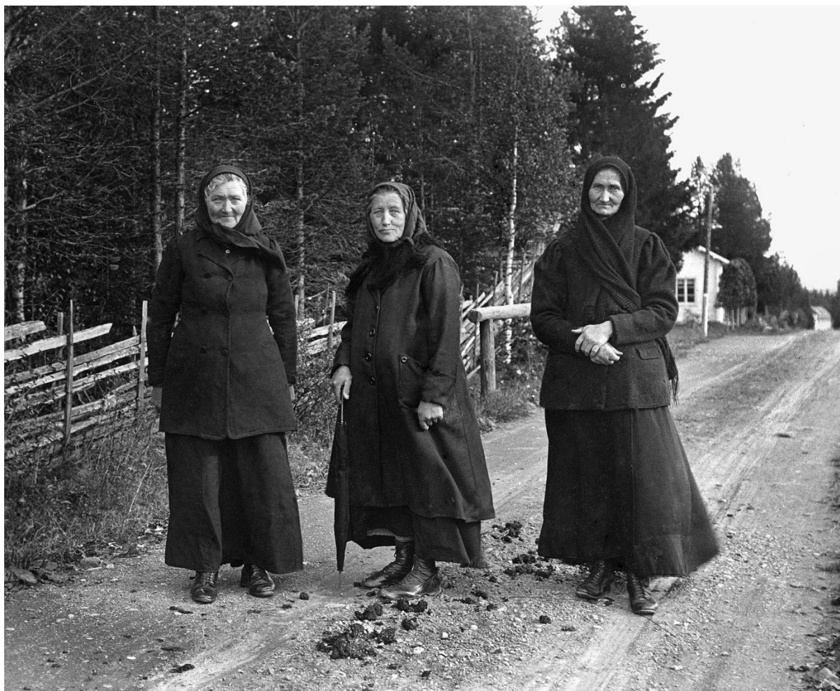
På väg till förbudsomröstningen 1922.

Förbudsomröstningen kallas folkomröstningen om alkoholhaltiga drycker. I Jämtland-Härjedalen har nykterhetsrörelsen varit mycket stark och här i länet röstade de allra flesta ja. Trots detta vann Nej-sidan med knapp marginal. Dokument som berättar hur man resonerade och arbetare i denna fråga hittar du i IOGT-logernas arkiv.